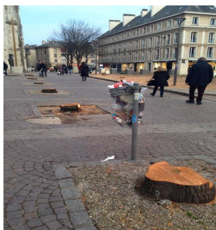
La situation actuelle