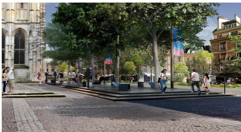
Images exportées du dossier Cœur de Métropole présenté le 5 juillet 2017